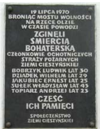
Tablica pamiątkowa przy Moście Wolności