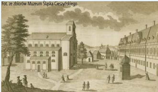
F.B. Werner, kościół ewangelicki w Cieszynie, 1734 r.