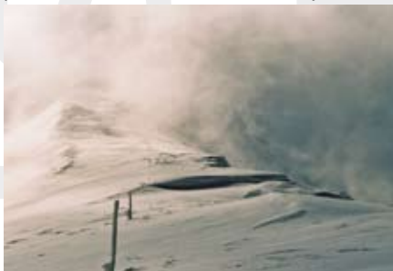
Jedna z fotografii Jarosława Bojdo

„Wystawa prezentuje fotografie z podróży. Celem moich wyjazdów przeważnie są góry. Cenię sobie obcowanie z naturą. Będąc już w nich poruszam się pieszo, rowerem lub na nartach. Na kliszy fotograficznej dokumentuję swoje małe wyprawy od 15 lat. Im wycieczka prostsza w środkach tym lepsza. Czyli namiot lub szałas, własny plecak. Jednym słowem pełna niezależność.” - Jarosław Bojdo