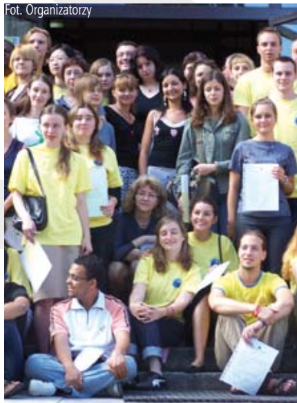
Uczestnicy letniej szkoły języka