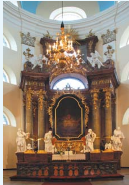
Ołtarz, 2008 r.