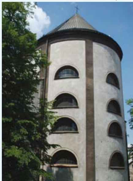
Kościół od strony wschodniej