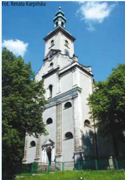
Kościół, 2008 r.