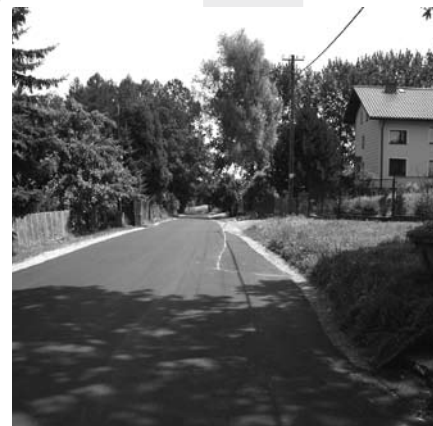
Wyremontowano także część ul. Hallera

Miejski Zarząd Dróg kontynuował będzie w 2009 roku roboty polegające na wykonaniu nowej nawierzchni bitumicznych dróg, zgodnie z zatwierdzonym przez Burmistrza Miasta planem rzeczowym i środkami finansowymi zagwarantowanymi na ich realizację.