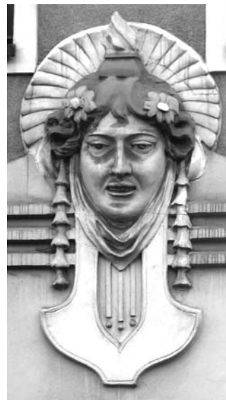
Jedna z wystawianych fotografii