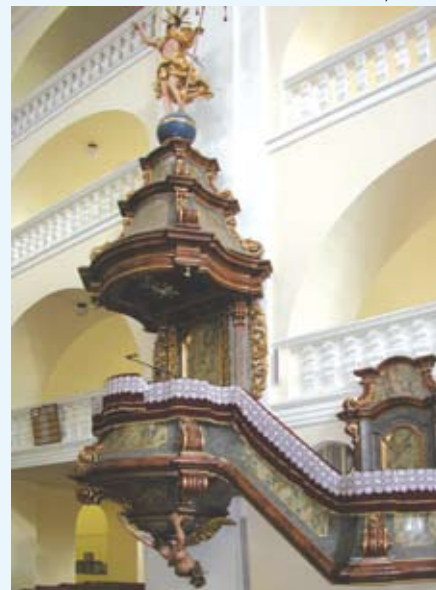
Ambona, 2008 r.