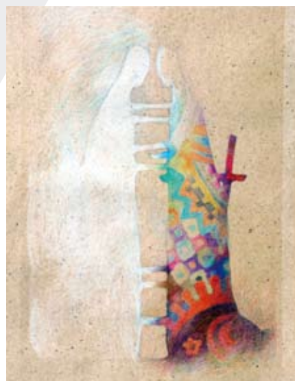
Jedna z prac prezentowanych na wystawie