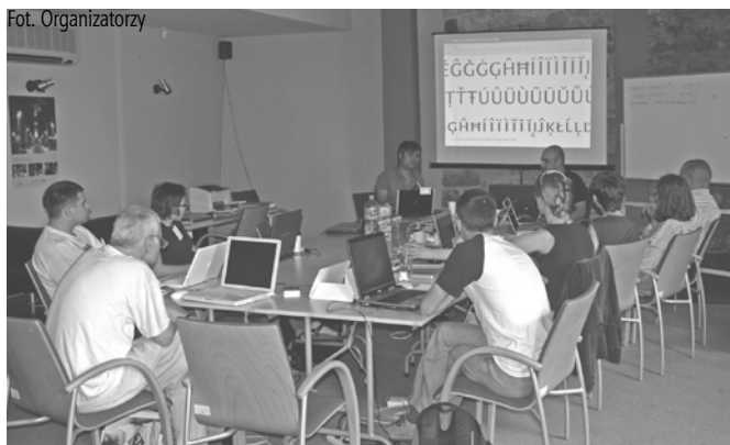
Uczestnicy warsztatów z prowadzącym

W dwutygodniowych warsztatach biorą udział projektanci i studenci z Polski, Czech oraz Wielkiej Brytanii zajmujący się projektowaniem czcionek, systemów identyfikacyjnych oraz znaków – szczególnie dla języków środkowo-europejskich.