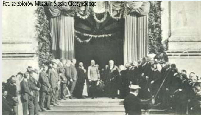
Cesarz Franciszek Józef I przed kościołem w 1906 r.